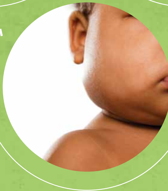
Inflamación de los ganglios en el cuello