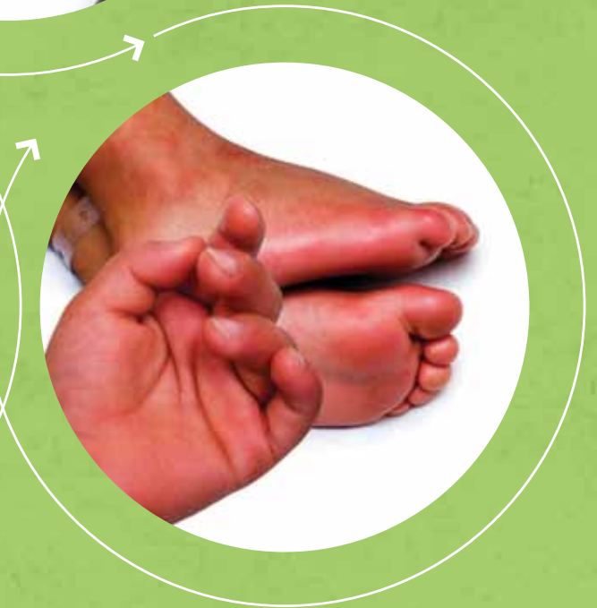
Manos y pies enrojecidos e inflamados